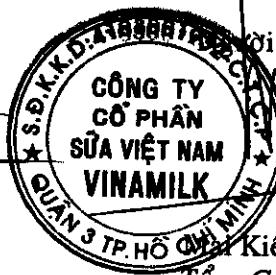
Quản lý Kiểm Liên Tổng Giám đốc